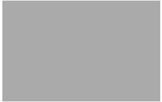
Bosque de Muniellos

Todos y cada uno de nosotros somos responsables del medio ambiente. Si queremos seguir disfrutando de dichos espacios vamos a tener que empezar a cambiar nuestra actitud. Cuando entramos en un espacio natural deberíamos tener en cuenta una serie de normas. La regla de oro es no dejar huella de nuestro paso. Para ello, tendríamos que acercarnos a estos santuarios naturales con respeto, como si estuviéramos viendo una obra de arte. A nadie se le ocurre llevarse una piedra de una catedral. Si no nos damos cuenta del daño que hacemos al entrar en los espacios naturales, correremos el riesgo de perder la oportunidad de descubrir los lugares escondidos y más preciosos de nuestro planeta. Nos veríamos obligados a dejar de disfrutar de la libertad de ir y venir a donde queramos. Debemos preguntarnos, ¿cómo nos sentiríamos si tuviéramos que mirar las bellezas naturales desde la distancia, sin poder desembarcar en una isla aislada o caminar por la costa?