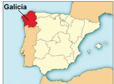
Mapa de España

Fui de vacaciones a Galicia, una región al noroeste de España, y fue increíble. Fui con mi familia y nos quedamos en un pueblo en la costa. Pasamos dos semanas en un hotel pequeño que se llamaba "Casa Don Paco". Lo bueno: estaba en el centro del pueblo, cerca de la playa, y tenía unas vistas espectaculares al mar. También, había muchos restaurantes y bares cerca del hotel. Lo malo: por las noches había mucho ruido y no podía dormir bien.