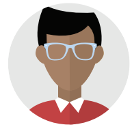
Mr Singh Mei he senitā 'o e kakai'

'Oku ou tui 'aupito ki he lau 'a e palōfesa'. Ko e 'elito 'o e nofo fe'ofofani' ia ko e ngāue fakataha ki he taumu'a 'e taha. 'Oku lahi 'a e ngaahi matakali, 'oku fakangatangata pe 'enau feohi' ki he kakai pē honau matakali'. 'Oku 'ikai ke nau lava kinautolu 'o feohi mo e ngaahi matakali kehe' 'o kau ai mo e kakai 'o e fonua' ni. Pea 'e 'osi e ngaahi ta'u, 'oku te'eki pē ke nau ako 'a e 'ulungaanga' mo mo'ui hangē ko e kakai honau fonua fo'ou'. 'Oku 'ikai ke nau maheni pē fa'a talanoa ki honau kaungā'api', pe kau atu ki he ngaahi polokalama 'a e komiuniti'. Ka nau toki kau pē ki he feohi mo e fakataha fakamatakali'.